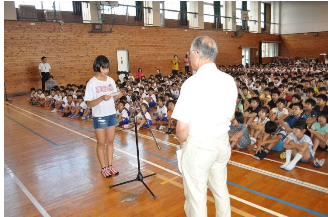
H29.9 宮崎南小学校 体育館内 男女1組設置

生徒達の学校生活に支障を来さないよう、夏休み期間中に作業に取り組みました 生徒さんから「洋式に変わったことで色々な人が使えるようになり私達も嬉しい。大切に使っていきたい。綺麗なトイレをありがとう」と感謝の気持ちを伝えて頂きました