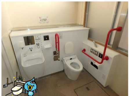
西池小学校多目的トイレ