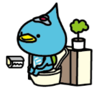
左 H29.9 櫛小学校